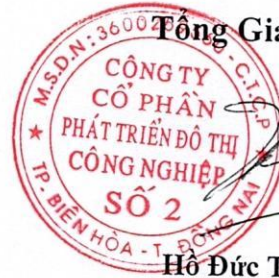
Hồ Đức Thành