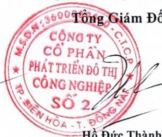
Hồ Đức Thành